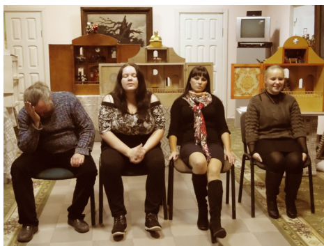
Фрагмент театрального занятия в семейном клубе «Вдохновение». Брагинский исторический музей с картинной галереей

Тихие зимние вечера, праздник ожидания праздника, сочельник накануне Рождества, следующие за Рождеством долгие священные вечера... Дома наполняются гостями, как правило, родственниками, потому что Рождество – праздник семейный. У славян, которым удалось сохранить религиозные праздники, обычаи и обряды во времена эпохи социализма, именно Рождество считается семейным праздником, а Новый год – это время встречи с друзьями, дружеских вечеринок. Рождество – это когда внутри больше, чем снаружи. Новый год – когда