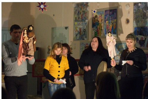
Спектакль «Рождественская мистерия» в исполнении участников семейного клуба «Вдохновение»

Участие в батлейке или просмотр театрального действия очень явственно связаны с вдохновением жизни, одушевлением омертвевших, недоразвитых, забытых, а потому наших больных частей. Это мистериальное театральное действие выводит зрителя и непосредственного участника на реальную встречу с собственными комплексами или трав-