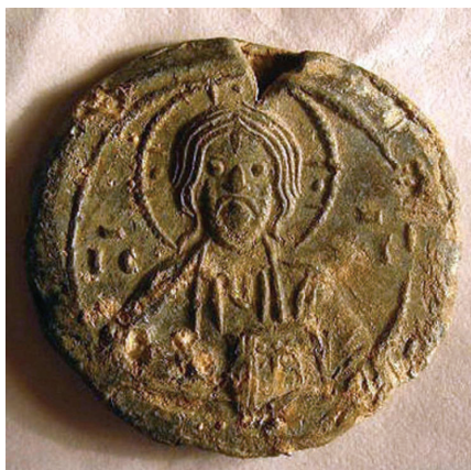
Актова печ ть Ефросиньи Полоцкой, XII в. (н ходк 2015 г.). Аверс с изобр жением лик Иисус Христ . Н цион льный Полоцкий историко-культурный музей-з поведник