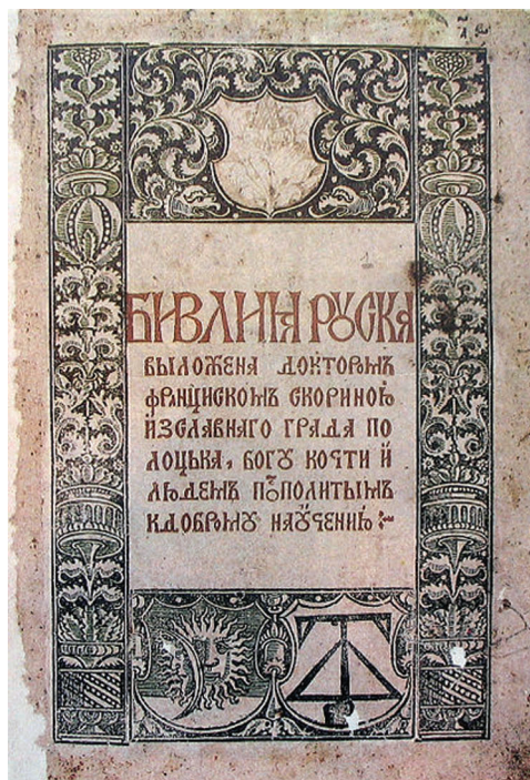
Титульный лист Библии, изд нной Франциском Скориной в Пр ге в 1517–1519 гг.

Белорусское Поозерье в XIV–XVIII вв. В сост в ВКЛ Полоцк вошел в 1307 г., Витебск – в 1320 г. Этому предшествов л период зн чительного политического и экономического осл бления Полоцк и Витебск , что было обусловлено фео- д льной р здробленностью Полоц-