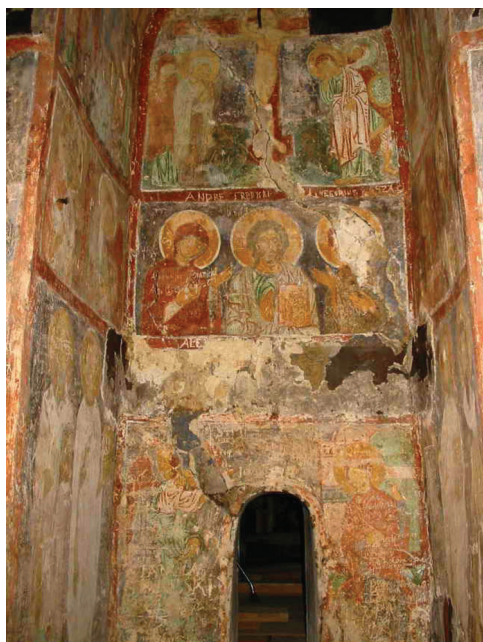
Фрески середины XII в. в Преображенском храме Спосо-Евфросиньевского монастыря в Полоцке

всёми областями Рюриков» [57]. Д. В. Дуконин на основе многолетних археологических изысканий было подтверждено, что с конца VIII по X в. Полоцк являлся племенным центром на территории распространения культуры смоленско-полоцких длинных курганов, отождествляемой с летописными кривичами. Согласно выводу ученого, скандинавы не оказали существенного влияния на процесс формирования социальной и топографической структуры Полоцка конца VIII–X вв. [35, с. 359]. Однако экономические и культурные контакты со скандинавами и Византией, обусловленные функционированием на территории Подвинья средневекового водного торгового пути «из варяг в греки», способствовали процессу формирования государствен-