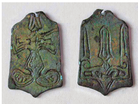
Подвески с княжеским знаменем Владимира Мстиславича, XI в., бронза, золочение (из коллекции 2012 г., 3 полоцкий посёлок, Полоцк).

псковскими и смоленскими. Данные группы в дальнейшем трансформировались в два самостоятельных политических объединения (племенные союзы): псковских и полоцко-смоленских кривичей. Формирование полоцко-смоленских кривичей происходило на протяжении VIII–XII вв. В данный этноэволюционный процесс было включено восточное население – дославянский субстрат (преимущественно балты) – при доминировании славянского элемента. Исследователи допускают, что крупные славянские и балтские группы, влившиеся в полоцко-смоленский союз кривичей, были выходцами из бассейна Вислы. По мнению В. В. Седова, прежде чем попасть в Подвинье, славяне из Висло-Одерского региона (венедская группа), пройдя через территорию Мазурского Поозерья и Среднего Поморья, первоначально осели в бассейне реки Великой и Псковского озера. Из данного региона на рубеже VII–VIII вв. они проникли в Белорусское Подвинье.