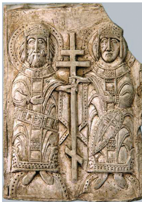
Каменистая икона XII в. с изображением святых равноапостольных Елены и Константины. Найдены при проведении раскопок в Полоцке и Верхнем Замятине. Национальный Полоцкий историко-культурный музей-заповедник

Крупные славянские миграции на территорию региона, согласно В. В. Седову, были две: в конце IV – начале V в., а также в VIII в. Древнейшими археологическими памятниками в регионе, указывающими на истоки формирования кривичей, В. В. Седов считает археологическую культуру смоленско-полоцких длинных курганов, создателями и носителями которой он признаёт славян, так и балтов, привнесших в тушемлинскую культуру обряд захоронения в длинные курганы. Согласно исследователям, по археологическим памятникам кривичи прослеживаются вплоть до XIII в. [98].