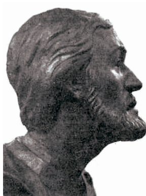
Бюст полочанин XIII–XIV вв. Происхождение: Лукомль, Чашинский р-н Витебской обл. Реконструкция И. В. Чквин. Скульпт. Л. П. Яшенко. Национальный исторический музей Беларуси. Национальный Полоцкий историко-культурный музей-заповедник

хов считает термин «кривичи» патронимическим названием, образованным от имени родоначальника [127]. Ландшфтерская гипотеза происхождения термина «кривичи» была предложена М. Ф. Филипенко, который предполагает, что первоначальное местность расселения кривичей была «кривой», т. е. холмистой [9, с. 24]. Вопрос о происхождении термина «полочане» не вызывает подобного разнобразия гипотез. Как правило, его происхождение выводится из названия город Полоцк, получившего, в свою очередь, имя от названия реки Полоты, на берегах которой он был основан.