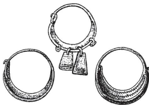
Височные украшения культуры смоленско-полоцких длинных кург нов

Вопрос об этнической идентификации летописных кривичей и полоч н вызвал в н учном сообществе ряд дискуссий. Можно выделить несколько основных н пр влений («сл вянское», «б лтское» и «протосл вянское»), которые по-р зному тр ктуют проблему этнической принадлежности кривичей. В историогр фии преобл д ет т кже две противополо-