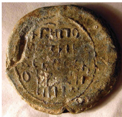
Актова печ ть Ефросиньи Полоцкой, XII в. (н ходк 2015 г.). Реверс с н дписью «Господи, помози р бе своей Офросинии». Н цион льный Полоцкий историко-культурный музей-з поведник

В современной белорусской этнологической н уке док зыв ется тезис о сл вянской этнической принадлежности кривичей, допуск ется, одн ко, возможность уч стия в их этногенезе б лтских групп [9, с. 32]. Выделение «полоч н» из кривичского племенного союз происходило, вероятно, в VIII–IX вв. Д нный процесс м ркиров ло формиров ние укрепленного городищ – «гр д» – н р. Полот [60, с. 36–37; 126]. Первое упомин ние о Полоцке содержится под 862 годом в «Повести временных лет»: «...И прия Рюрикъ вл сть всю одинъ, и пришедь къ Ильмерю, и сруби городъ н дъ Волховомъ, и прозв ш й Новгород, и съде ту княж и р зд я мужемъ своимъ волости, и города руб ти, овому Польшескъ, овому Ростовъ, другому Бъллозеро. И по тъмъ городомъ суть н ходницъ В рязи; първи н селници в Новгородъ Словенъ, и в Полотъскъ Кривичи, Ростовъ Меряне, н Бъллозеръ Весь, Муромъ Муром , и тъмн