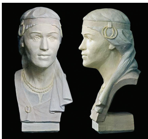
Бюст полочанки XI в. Происхождение: Домжерицы, Лепельский р-н Витебской обл. Реконструкция И. В. Чквин. Скульпт. Л. П. Яшенко. Национальный исторический музей Беларуси

Дискуссионным является вопрос о происхождении названия «кривичи». Выказываются гипотезы о балтском генезисе данного термина (например, от литовского kirba – топь либо krivis – кривой). Однако в славянских языках корень крив- имеет широкое распространение, в том числе в топонимии и антропонимии, что указывает прежде всего на актуальность поиска славянской этимологии этнонима «кривичи». Г. В. Шты-